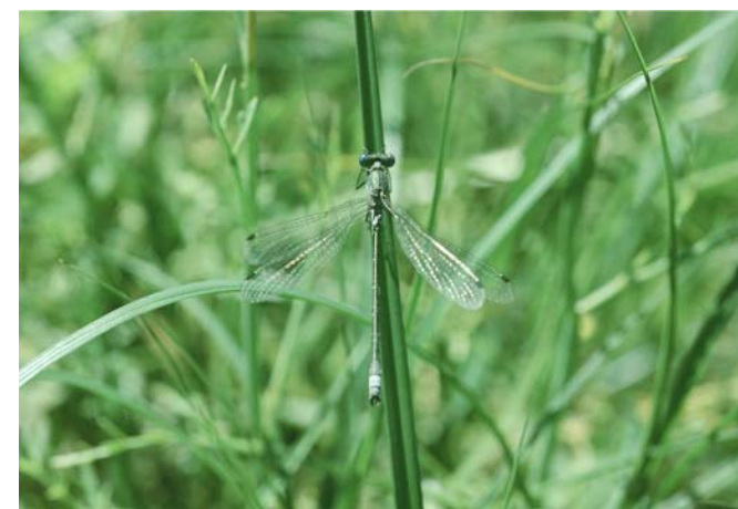
Lestes dryas, une espèce menacée qui a également profité des aménagements réalisés