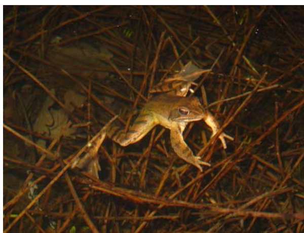
Les aménagements réalisés visaient spécifiquement la rare grenouille agile