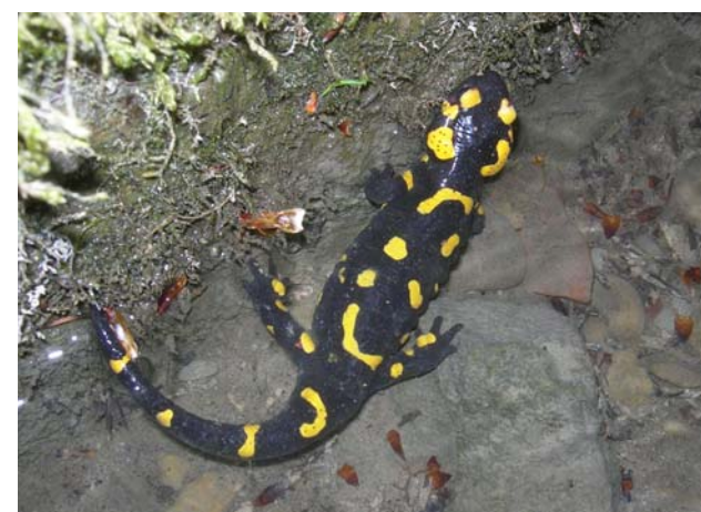
Salamandre tachetée adulte dans la Lutrive