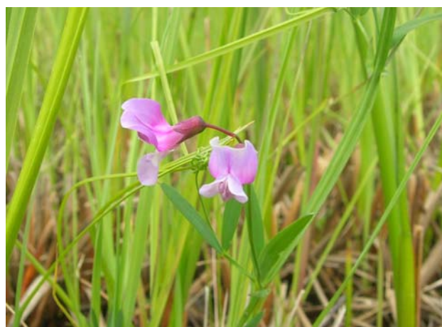
Lathyrus palustris, une des découvertes remarquables de notre expertise