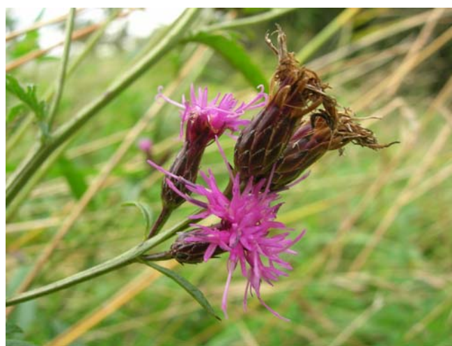
Serratula tinctoria s.str., espèce rare inféodée aux prairies humides