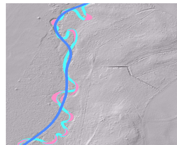
Cours du Veyron avant 1850 et actuel